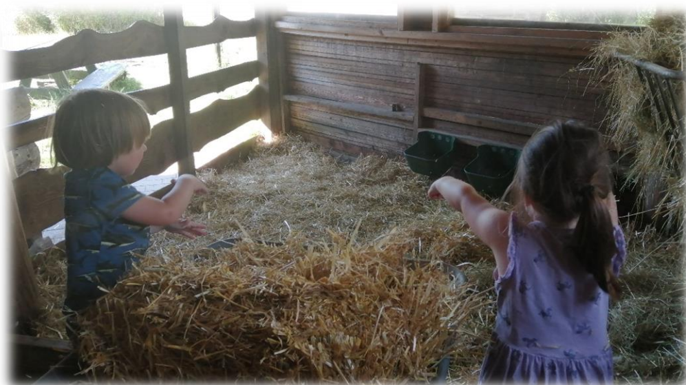
To børn er travlt beskæftiget med at ordne stald hos vores geder, Gerda og Viola.

I spisesituationer er der mulighed for samtale i fællesskab, og her er det vores opgave som voksne at give alle børn mulighed for at deltage i dialogen, invitere dem der ikke får sagt så meget og give det, de bidrager med, værdi.